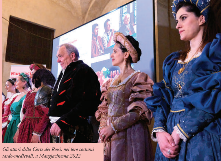
Gli attori della Corte dei Rossi , nei loro costumi tardo-medievali, a Mangiacinema 2022

Proiezione di Io e mia sorella (1987) di Carlo Verdone, con Ornella Muti, Carlo Verdone e Elena Sofia Ricci