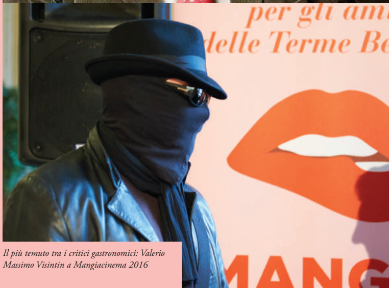
Il più temuto tra i critici gastronomici: Valerio Massimo Visintin a Mangiacinema 2016