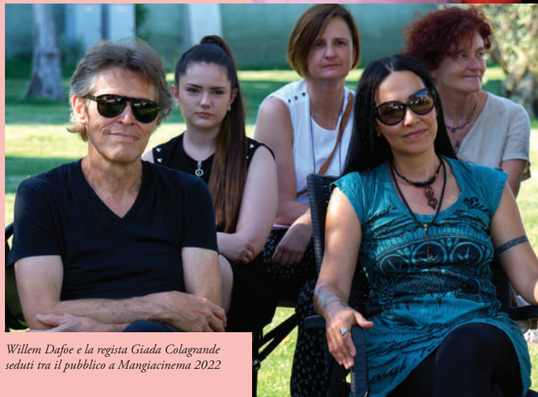
Willem Dafoe e la regista Giada Colagrande seduti tra il pubblico a Mangiacinema 2022