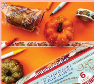
Lo storico Plumkè Pattini