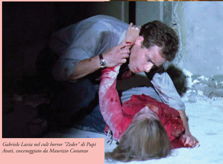
Gabriele Lavia nel cult horror "Zeder" di Pupi Avati, sceneggiato da Maurizio Costanzo