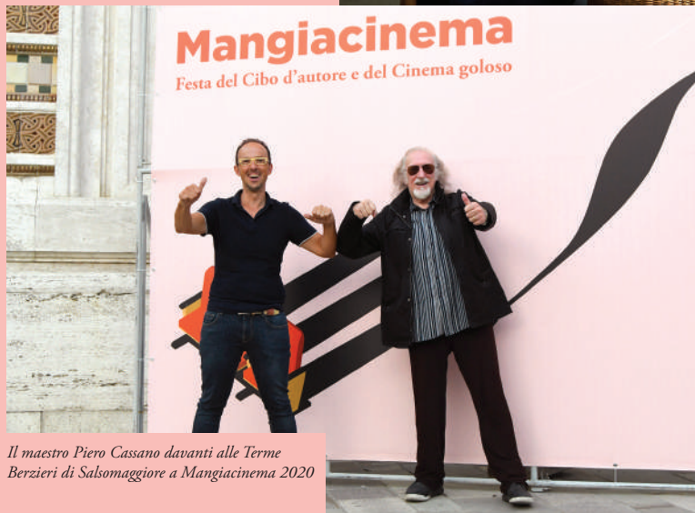
Il maestro Piero Cassano davanti alle Terme Berzieri di Salsomaggiore a Mangiacinema 2020