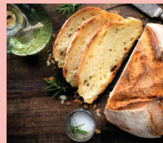
I grandi lievitati di ImpastoZero