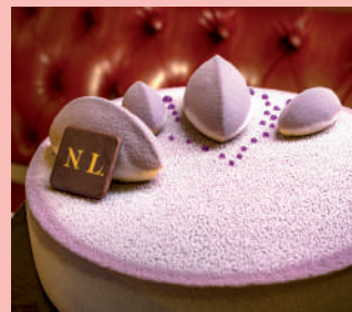
Le delizie della Nuova Pasticceria Lady