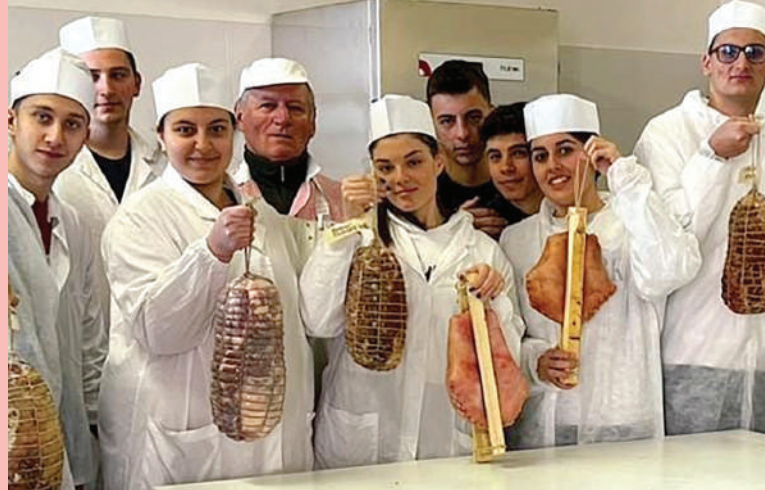
Spalla cruda e norcineria: gli studenti dell'Istituto Galileo Galilei di San Secondo Parmense

Proiezione della versione restaurata di Sapore di mare (1983) di Carlo Vanzina, scritto da Enrico e Carlo Vanzina, con Isabella Ferrari, Virna Lisi, Marina Suma, Jerry Calà, Christian De Sica