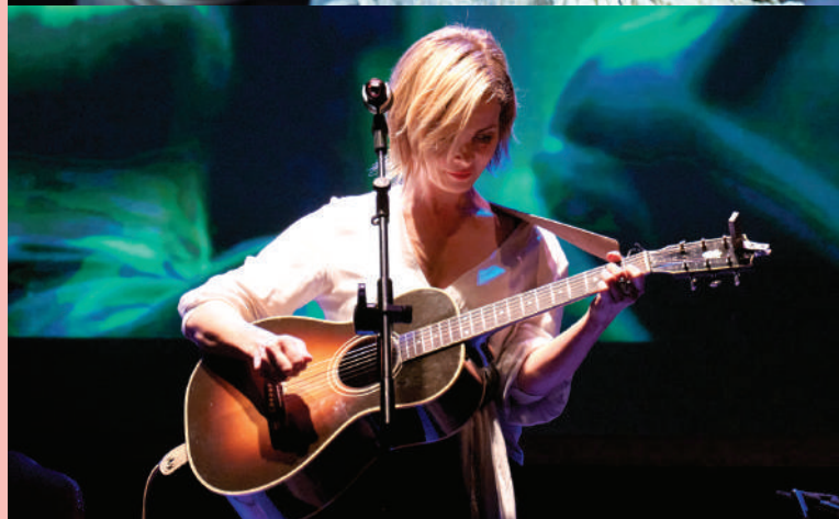
Violante Placido sul palco del Teatro Magnani di Fidenza a Mangiamusica 2022