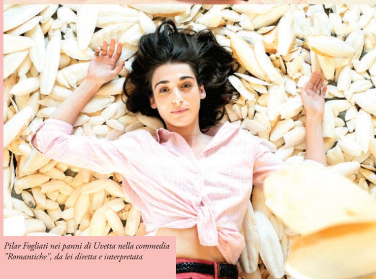
Pilar Fogliati nei panni di Uvetta nella commedia "Romantiche", da lei diretta e interpretata