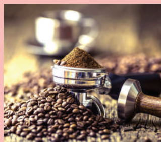
I caffè della Torrefazione Lady Café