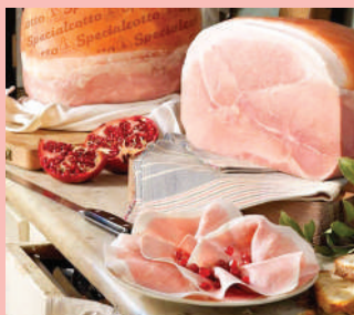
Il cotto '60 di Branchi Prosciutti