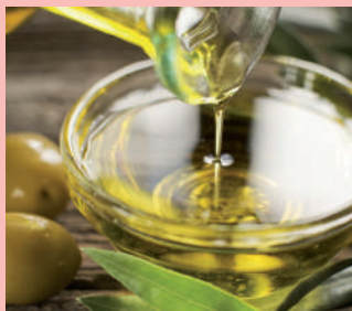
Gli oli extravergine di Coppini Arte Olearia

E poi: gli anolini e i tortelli della Trattoria La Maestà di Ronco Campo Canneto, i salumi dell'Hostaria da Ivan di Fontanelle, il culatello del Salumificio Squisito di Soragna, i vini delle Cantine Bergamaschi 1909 di Samboseto, la torta fritta dell'Osteria Antica Rocca di San Quirico