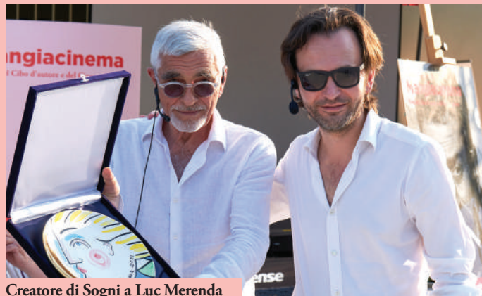
Creatore di Sogni a Luc Merenda