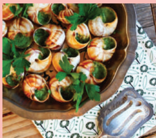
Le lumache dell'Elicicoltura Parizzi