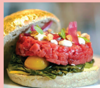
Gli hamburger gourmet del Ristorante Romani