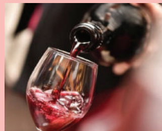
I vini Cantine Bergamaschi 1909, Amadei e Consorzio Vini Colli di Parma