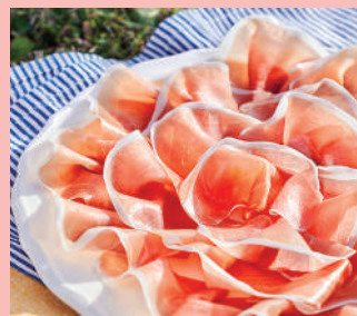
Il Prosciutto di Parma del Consorzio