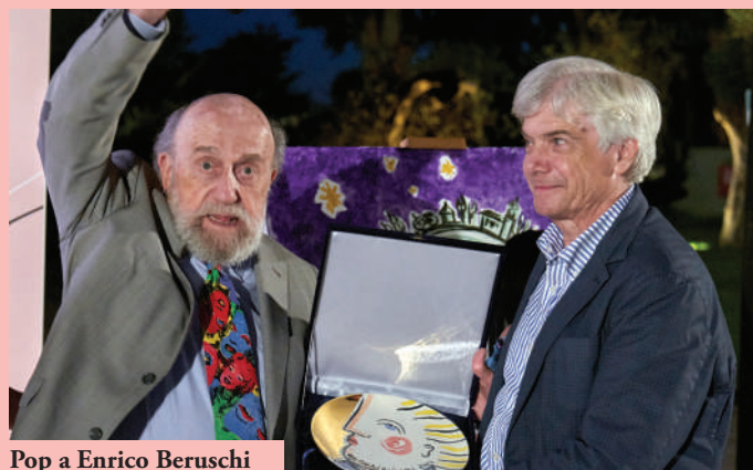
Pop a Enrico Beruschi