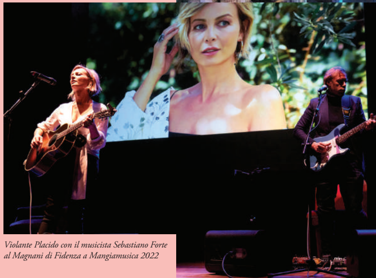
Violante Placido con il musicista Sebastiano Forte al Magnani di Fidenza a Mangiamusica 2022