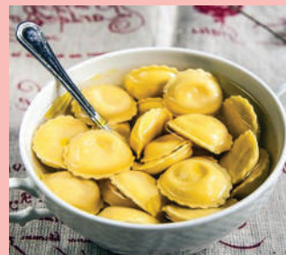
Gli anolini della Trattoria La Maestà