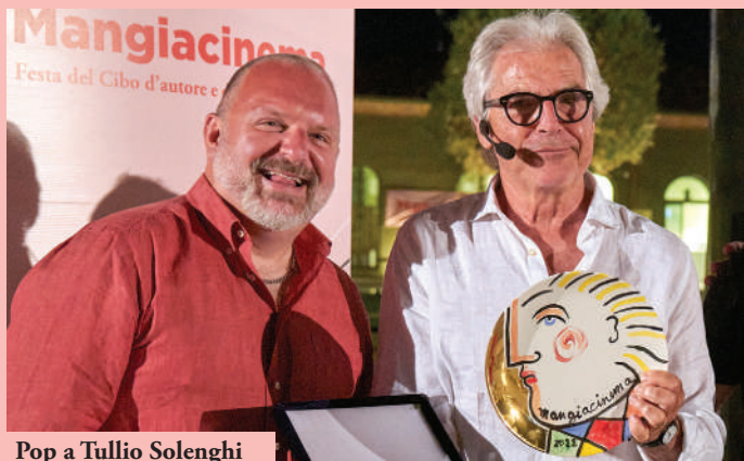
Pop a Tullio Solenghi