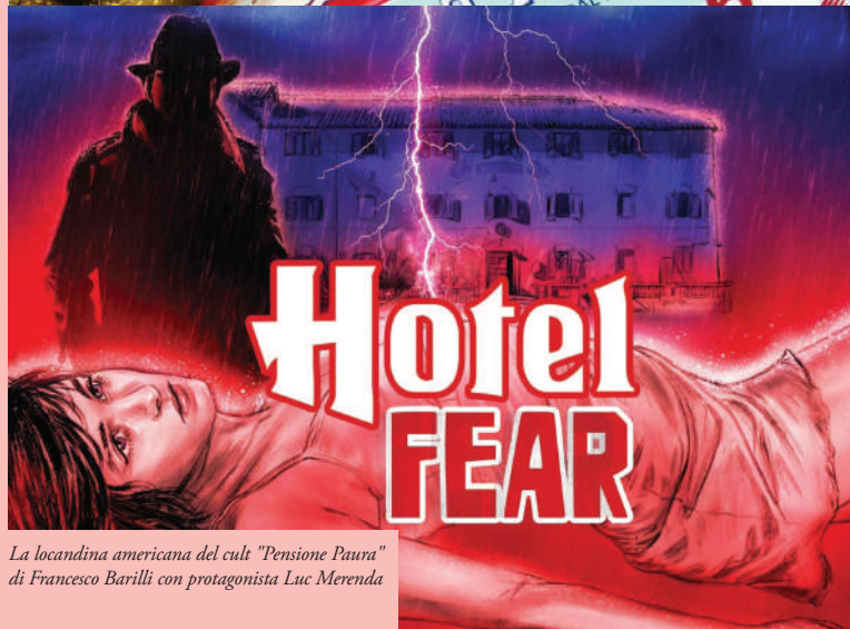
La locandina americana del cult "Pensione Paura" di Francesco Barilli con protagonista Luc Merenda