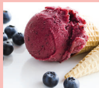
Le creazioni artigianali di Fior di Gelato