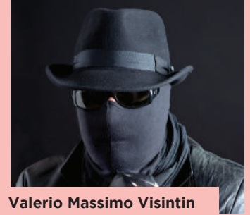
Valerio Massimo Visintin