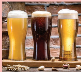
Le birre artigianali del Birrificio Legnone