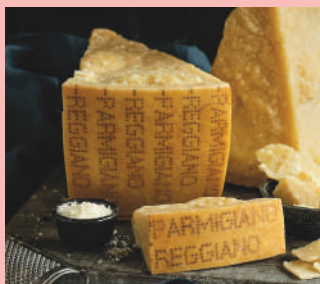
Il Parmigiano Reggiano del Consorzio