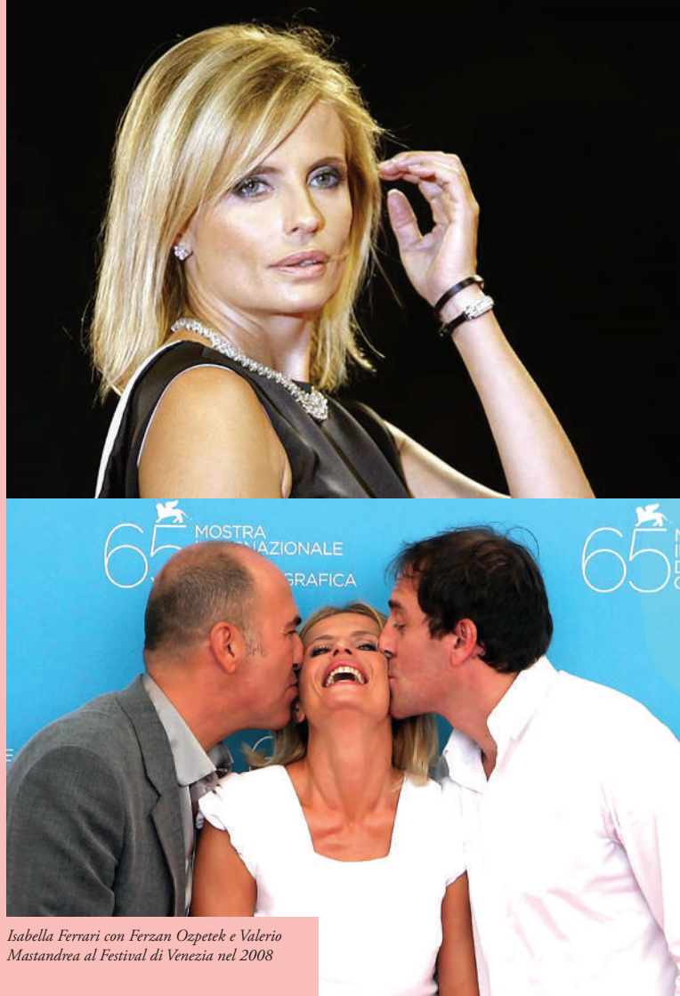
Isabella Ferrari con Ferzan Ozpetek e Valerio Mastandrea al Festival di Venezia nel 2008

Questo sabato conclusivo di Mangiacinema inizierà alle 20, con la Festa del Made in Bassa nel Cortile d'onore della Rocca dei Rossi: i migliori artisti del gusto del territorio presenteranno e offriranno al pubblico, in degustazione gratuita, le loro specialità, in attesa dell'arrivo della grande attrice di origini piacentine.