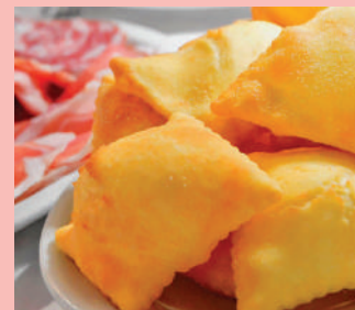
La torta frita dell'Osteria Antica Rocca