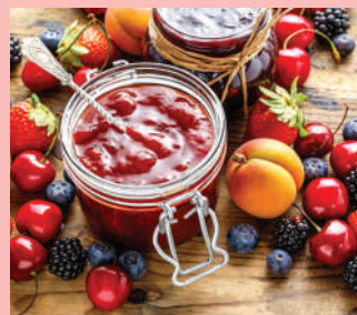
Le "Bontà di Parma" di Food Farm 4.0