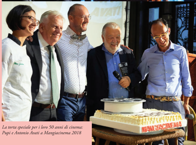
La torta speciale per i loro 50 anni di cinema: Pupi e Antonio Avati a Mangiacinema 2018