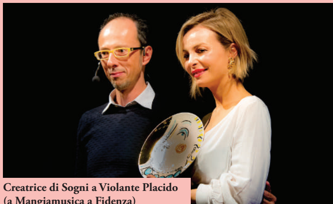
Creatrice di Sogni a Violante Placido (a Mangiamusica a Fidenza)